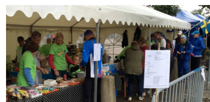
IF Marin Väst och Lerums SOK sköter kafeterian på Eriksbergsetappen.